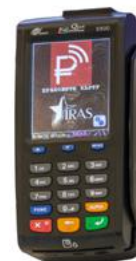
Модель ПТК «IRAS 900 K»

Рекомендованная розничная цена (с учетом фискального накопителя)