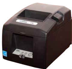
Модель ПТК «MSTAR-TK»

Рекомендованная розничная цена (с учетом фискального накопителя)