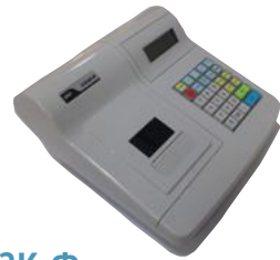
Модель ЭКР 2102К-Ф

Рекомендованная розничная цена (с учетом фискального накопителя)