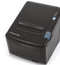
Модель ККТ «Ритейл-01Ф»

Рекомендованная розничная цена (с учетом фискального накопителя)