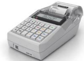
Модель ККТ ЭЛВЕС-МФ

Рекомендованная розничная цена (с учетом фискального накопителя)