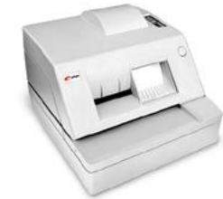
Модель ККТ «ПРИМ 07-Ф»

Рекомендованная розничная цена (с учетом фискального накопителя)