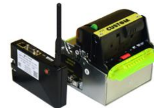
Модель ККТ PAYONLINE-01-ФА

Рекомендованная розничная цена (с учетом фискального накопителя)