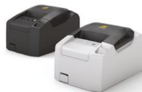
Модель ККТ «PP-02Ф»

Рекомендованная розничная цена (с учетом фискального накопителя)