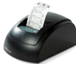
Модель ККТ «Вики Принт 57Ф»

Рекомендованная розничная цена (с учетом фискального накопителя)