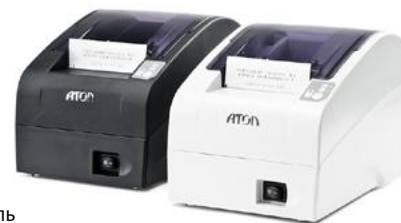
Модель АТОЛ FPrint-22ПТК

Рекомендованная розничная цена (с учетом фискального накопителя)