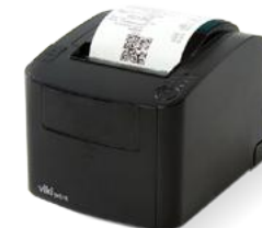
Модель ККТ «Вики Принт 80 плюс Ф»

Рекомендованная розничная цена (с учетом фискального накопителя)