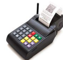
Модель АТОЛ 90Ф

Рекомендованная розничная цена (с учетом фискального накопителя)