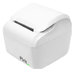
Модель Пирит 2Ф/Пирит 2СФ

Рекомендованная розничная цена (с учетом фискального накопителя)