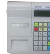
Модель МИНИКА 1102МК-Ф

Рекомендованная розничная цена (с учетом фискального накопителя)