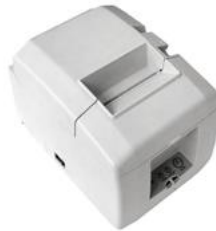
Модель ККТ «ПРИМ 08-Ф»

Рекомендованная розничная цена (с учетом фискального накопителя)