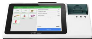
Модель ККТ «Вики мини Ф»

Рекомендованная розничная цена (с учетом фискального накопителя)