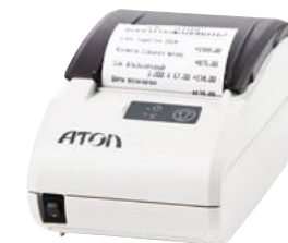
Модель АТОЛ 11Ф

Рекомендованная розничная цена (с учетом фискального накопителя)