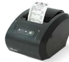
Модель ККТ «Вики Принт 57 плюс Ф»

Рекомендованная розничная цена (с учетом фискального накопителя)