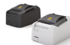
Модель ККТ «PP-03Ф»

Рекомендованная розничная цена (с учетом фискального накопителя)