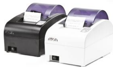
Модель АТОЛ 55Ф

Рекомендованная розничная цена (с учетом фискального накопителя)