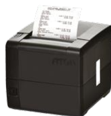
Модель АТОЛ 25Ф

Рекомендованная розничная цена (с учетом фискального накопителя)