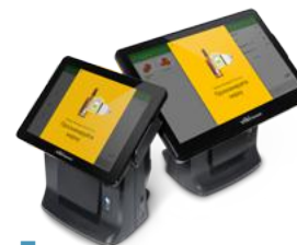
Модель ККТ Viki Tower F

Рекомендованная розничная цена (с учетом фискального накопителя)