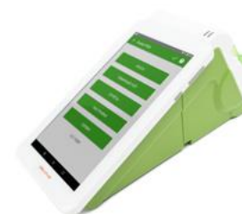
Модель ККТ «Эвотор СТ2Ф»

Рекомендованная розничная цена (с учетом фискального накопителя)