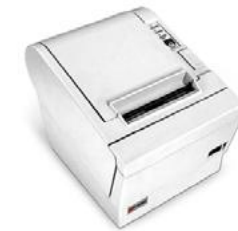
Модель ККТ «ПРИМ 88-Ф»

Рекомендованная розничная цена (с учетом фискального накопителя)