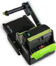
Модель ККТ «ПРИМ 21-ФА»

Рекомендованная розничная цена (с учетом фискального накопителя)