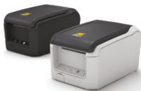
Модель ККТ «PP-01Ф»

Рекомендованная розничная цена (с учетом фискального накопителя)