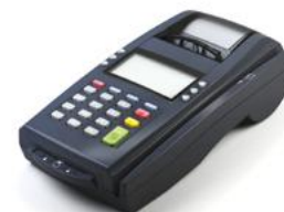
Модель ЯРУС ТФ

Рекомендованная розничная цена (с учетом фискального накопителя)