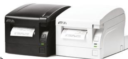
Модель АТОЛ 77Ф

Рекомендованная розничная цена (с учетом фискального накопителя)