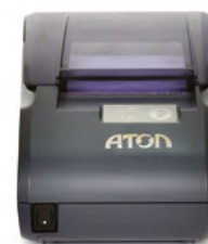
Модель АТОЛ 30 Ф

Рекомендованная розничная цена (с учетом фискального накопителя)