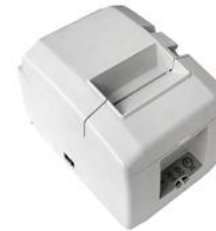
Модель ККТ «ПРИМ 08-Ф»

Рекомендованная розничная цена (с учетом фискального накопителя)