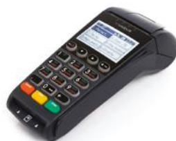
Модель ЯРУС М2100Ф

Рекомендованная розничная цена (с учетом фискального накопителя)