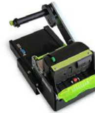
Модель ККТ «ПРИМ 21-ФА»

Рекомендованная розничная цена (с учетом фискального накопителя)