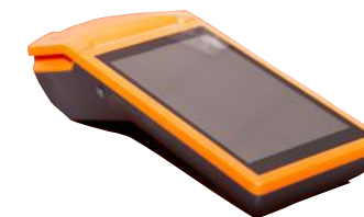
Модель ПТК «MSPOS-K»

Рекомендованная розничная цена (с учетом фискального накопителя)