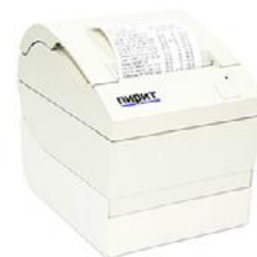
Модель Пирит 1Ф

Пирит 2СФ (с Ethernet кабелем) – 36 000 руб.